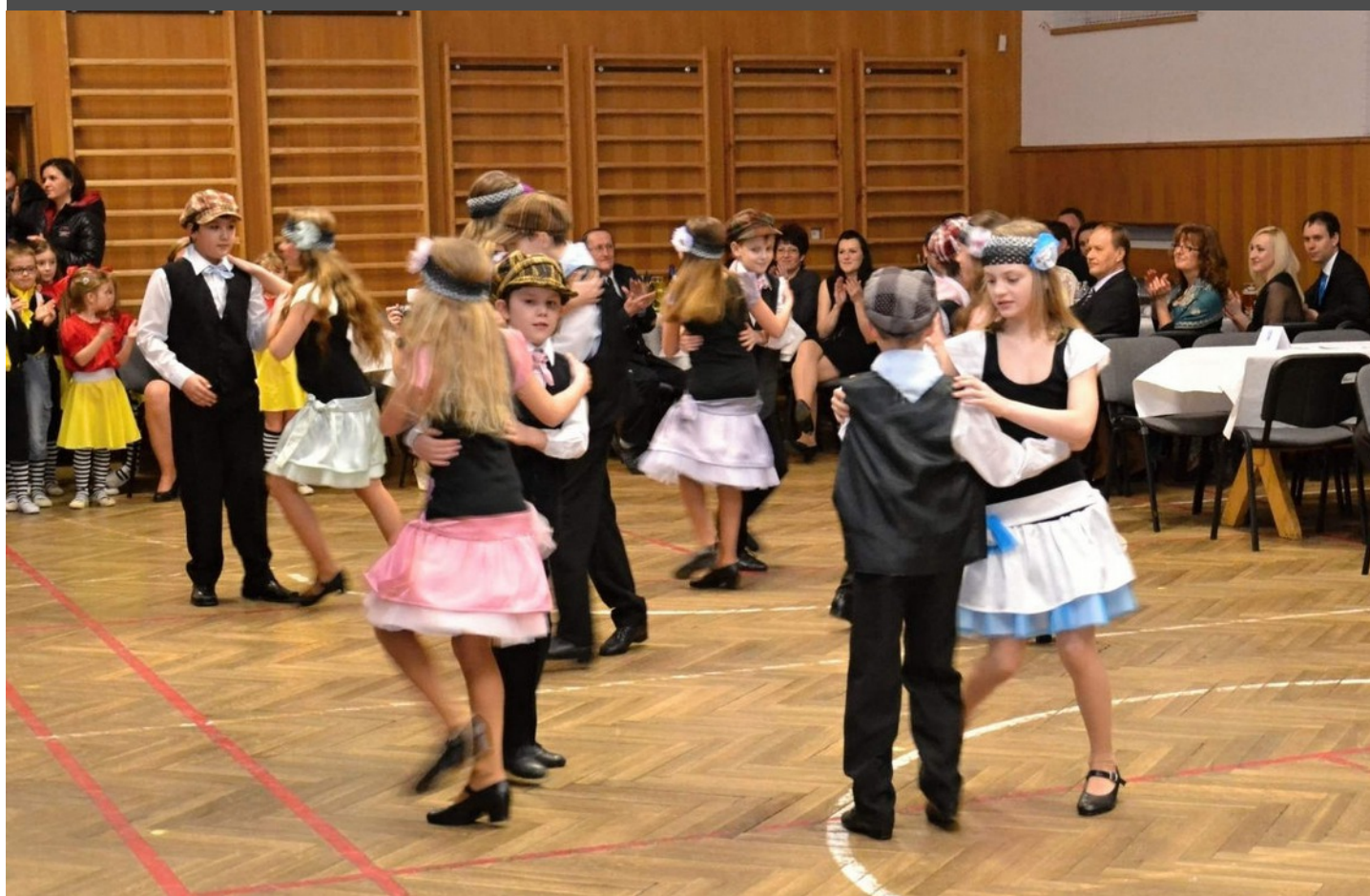
Obecní ples 31. 1. 2015