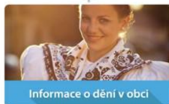
Informace o dění v obci