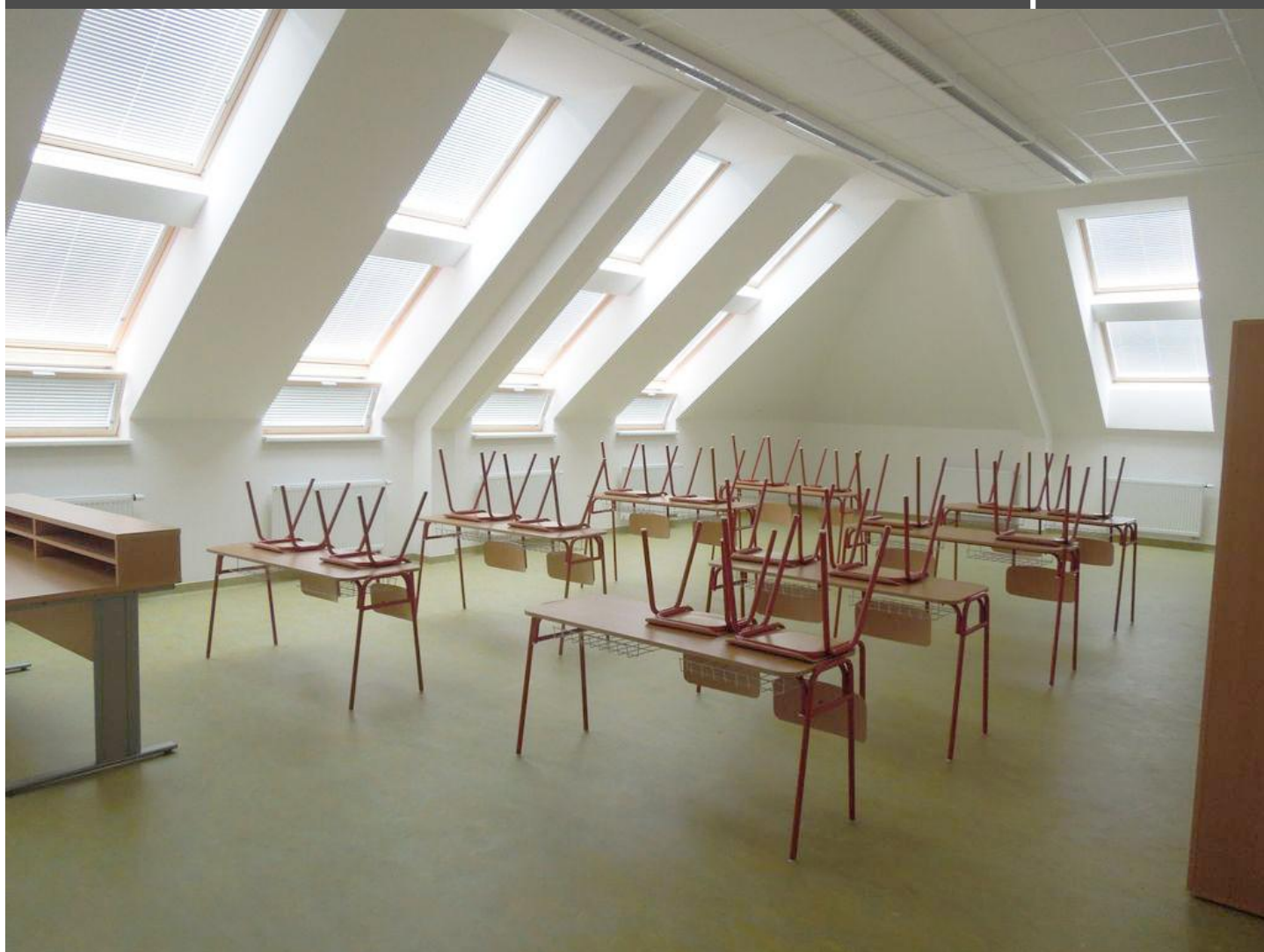
Dostavba základní školy v Čebíně