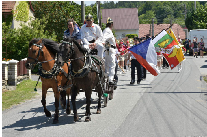
Foto: Oslavy v Býšovci 8. 7. 2017

8. 7. 2017 jsme měli možnost předvést naši koňskou stříkačku na oslavách hasičů v Býšovci, kde se slavilo 120 let od založení sboru. Je to malá obec přímo nad hradem Pernštejnem. Sbor v Kanicích oslavoval 26. srpna 125. výročí založení. Opět jsme předvedli naši koňskou stříkačku.