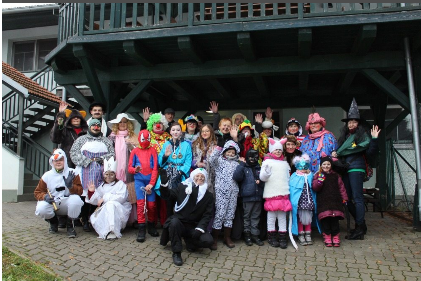
Masopustní průvod 2018