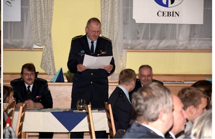
Foto: Výroční valná hromada SDH Čebín

Zásahová jednotka sboru má k dispozici hasičský vůz IVECO a cisternový vůz Praga V3-S z roku 1951 s obsahem cisterny 3500 litrů. Jednotka čítá 18 členů. V roce 2017 byl poplach jednotce vyhlášen celkem třikrát. Jmenovitě jsou to tyto zásahy: