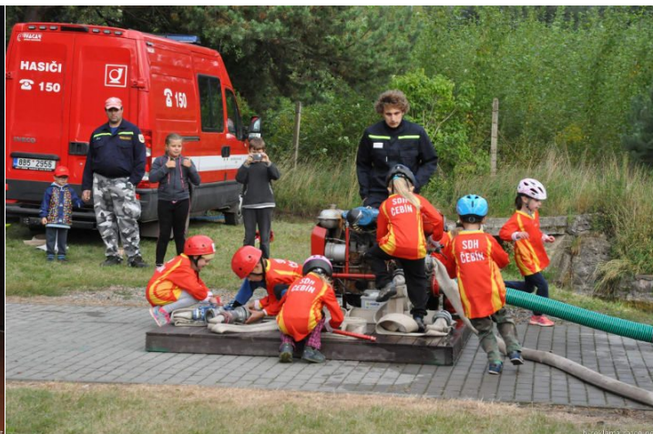
Foto: Noční závody O pohár starosty obce Čebín 2017