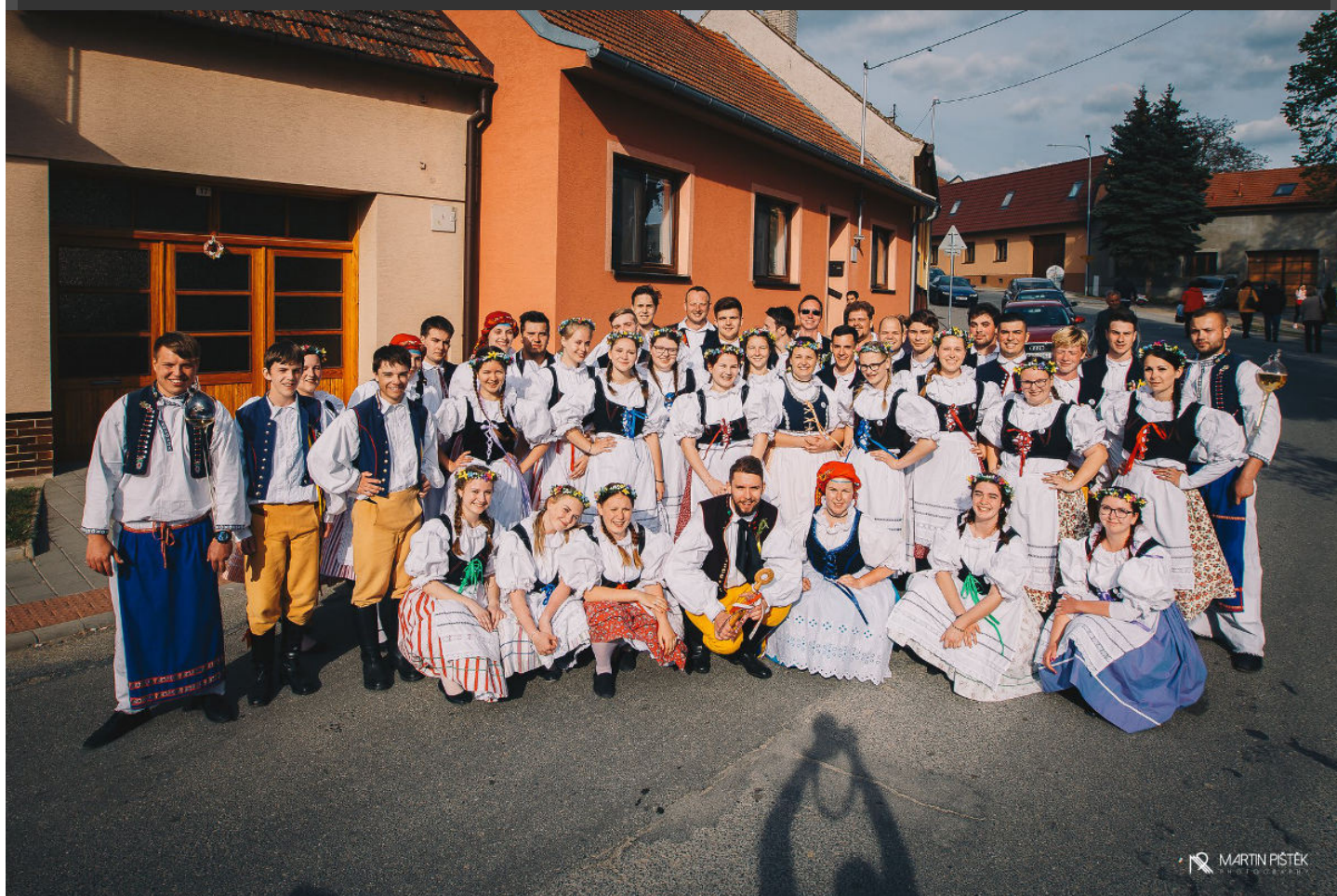
Krojované hody 2019